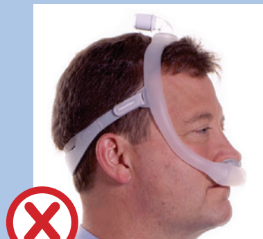
Maske zu klein