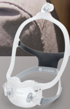
DreamWear Full Face