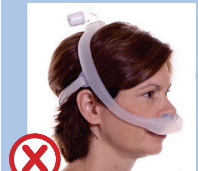
Maske zu groß