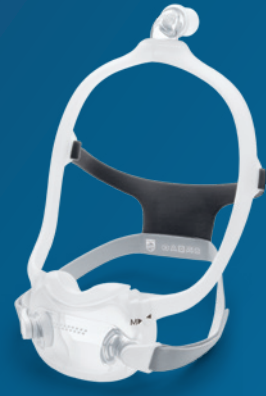
DreamWear Full Face