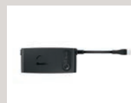
Akku (in Kürze verfügbar)