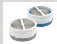
HumidX (Standard), HumidX Plus (für besonderen Feuchtigkeitsbedarf)