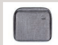
Premium-Reisetasche für AirMini