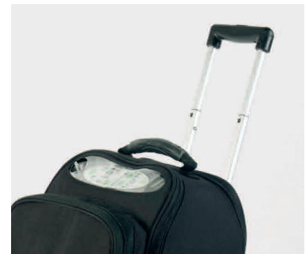
Transportwagen mit ausziehbarem Griff