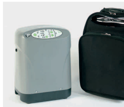
iGo mit Transportwagen